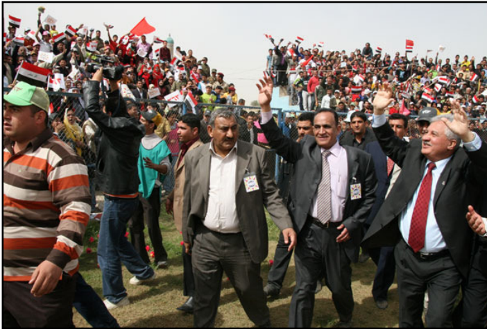
حضور هزاران تن از مردم بغداد در همایش انتخاباتی "اتحاد الشعب" - اتحاد مردم، به رهبری حزب کمونیست عراق - نفر جلو رفیق حمید مجید موسی، رهبر حزب کمونیست عراق

ربودند معنای دیگری ندارد. این بار نیز چنین ترفند انتخاباتی برای دست یازی به کرسی‌های اضافی در مجلس از سوی همان گروه‌ها به کار گرفته شد. بر اساس برآورد رشد جمعیت به ۳۲ میلیون نفر در چهار سال گذشته، شمار اعضای مجلس از ۲۷۵ به ۳۲۵ نماینده برای مجلس نوین افزایش یافته است. این مسئله به وجود یک نقص بنیادی در روند انتخابات اشاره می‌کند که معلول نبود یک فهرست مناسب از انتخاب‌کنندگان بر اساس سرشماری جمعیت است. لیکن این سرشماری که می‌بایست تا پایان سال ۲۰۰۹ انجام می‌گرفت به تعویق انداخته شد. در عراق نام‌نویسی واجدین شرایط بر پایه داده‌های چرخه توزیع جیره غذایی که سرشار از اشتباه است و می‌تواند به آسانی مورد دستکاری قرار گیرد، انجام می‌پذیرد. بنابر برآورد تخمینی برای حدود ۱/۲ میلیون نفر واجدین شرایط رای که بیرون از عراق بسر می‌برند، هیچ‌گونه مرجع نام‌نویسی رسمی وجود ندارد، با این وجود بر طبق شرایط خودسرانه اعلام شده از سوی کمیسیون رای، آنها ملزم به نام‌نویسی و رای دادن هستند.