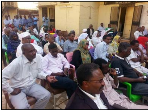
جلسه اخیر حزب کمونیست سودان در خارطوم